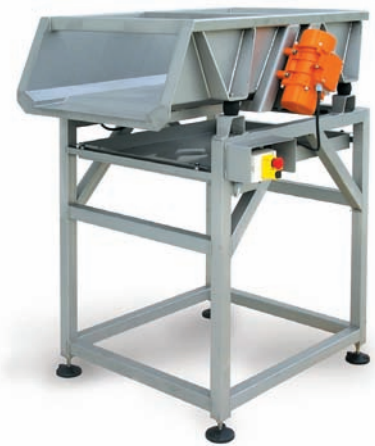
TAVOLO DOSATORE TVD Vibrating table for grapes reception Vibreux-égouttoir de réception Rütteltisch traubendosierer Mesa vibrante dosificacion uva