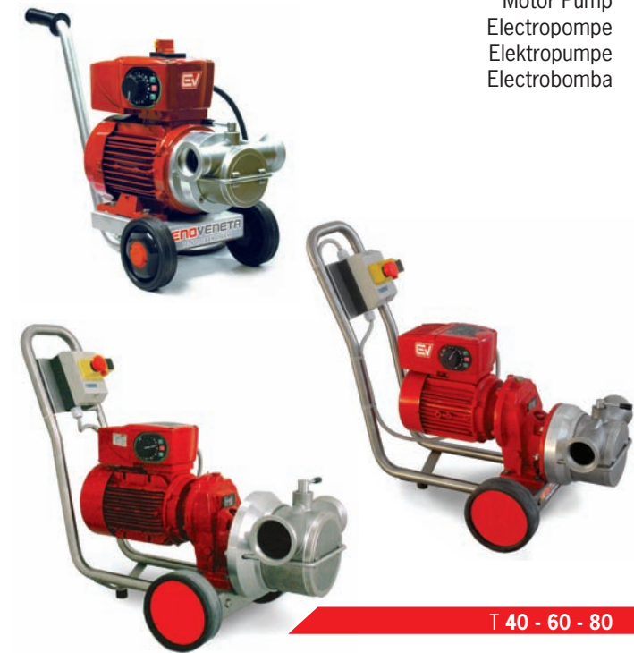
T 40 - 60 - 80

Elettropompa Motor Pump Electropompe Elektropumpe Electrobomba