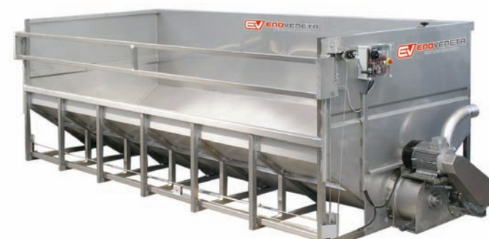
TRAMOGGIA misure a richiesta Custom-made hoppers Trémie Trichter Tolva