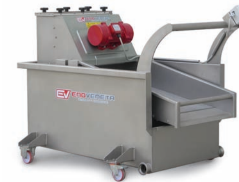
VS 2 - VS 4

Svinatore vibrante Vibrating deseeding table Epepneur vibrant Vibrierender Moststecher Desvinador vibrante