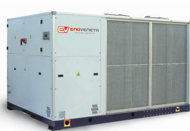
UNITA' FRIGORIFERE da 4.000 a 1.000.000 Kcal/h

Centrali frigorifere Refrigeration plants Centrales frigorifiques Weinkühler Instalaciones frigoríficas