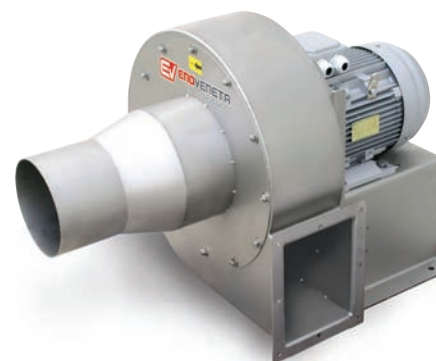
ASPIRATORE PER RASPI da 4 a 19 kW Exhaust fan Aspirateur pour rafles Absauger für Traubenkämme Aspirador para escobajos