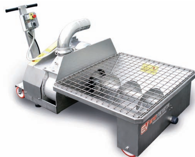
EVP 1 - EVP 2

Pompa Ellittica Pumps elliptical rotor Pompe à rotor elliptique Pumpe mit elliptischem Rotor Bomba de rotor eliptico