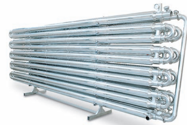
SCAMBIATORI DI CALORE da 12.000 a 1.000.000 Kcal/h Heat exchange plants Echangeurs de chaleur Wärmeaustauscher Intercambiadores de calor