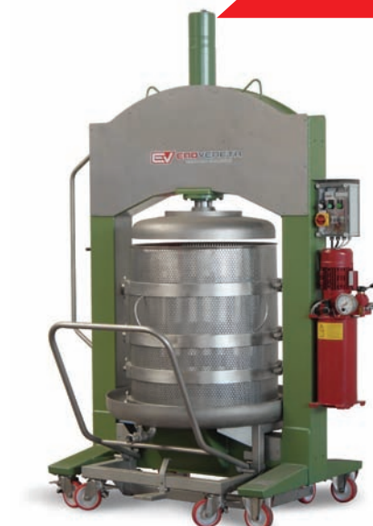
PRESSA OLEODINAMICA Cage press Pressoir hydraulique Hydraulikpressen Prensa oleodinamica

La qualità della tradizione, l'affidabilità della tecnologia