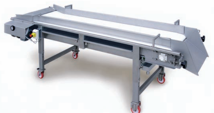
NASTRO CERNITA NC Grape selection belt Table de tri à bande Trauben-sortierbänder Cintas de seleccion