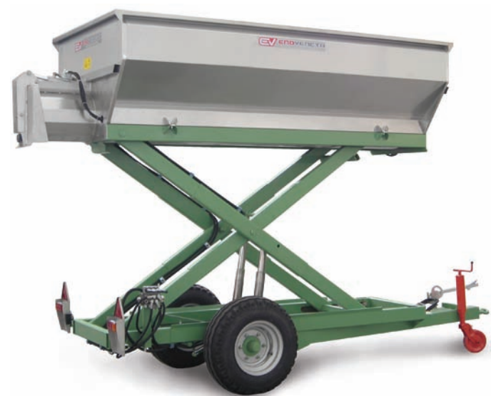
CARRO IDRAULICO Harvesting wagon Benne à vendange Weinlesewagen Carro de vendimia hidraulico

Grapes reception plants Benne et réception du raisin Weinlese Anlagen Instalaciones de recoleccion uva