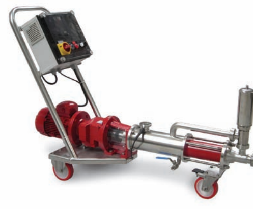
MOHNO V - I

Pompa peristaltica Peristaltic pump Pompe péristaltique Peristaltische Pumpe Bomba peristáltica