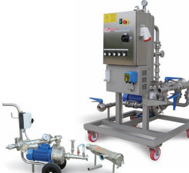
CLEAR 50 - 150 - 300

Flottatore Floating Flottateur Flotationsanlagen Flotador