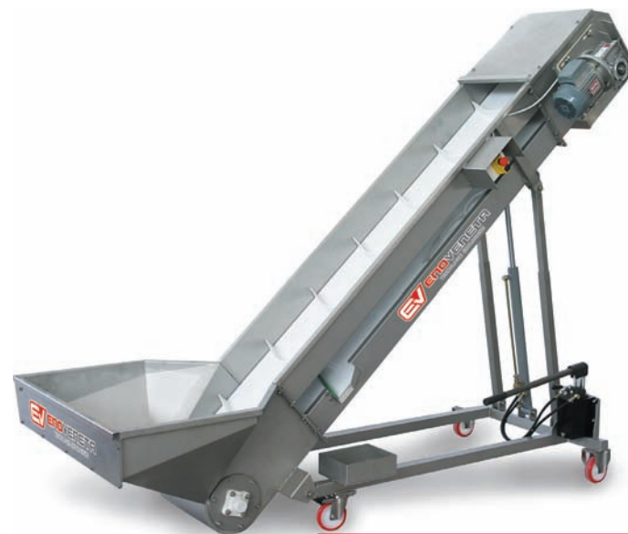
NASTRO ELEVATORE NE Grape conveyor belt Tapis élévateur Traubenheber Cintas elevadoras

Grapes reception and sorting lines Système de réception et triage du raisin Annahme- und Auswhlssysteme der Trauben Linea de recepcion y seleccion de uvas